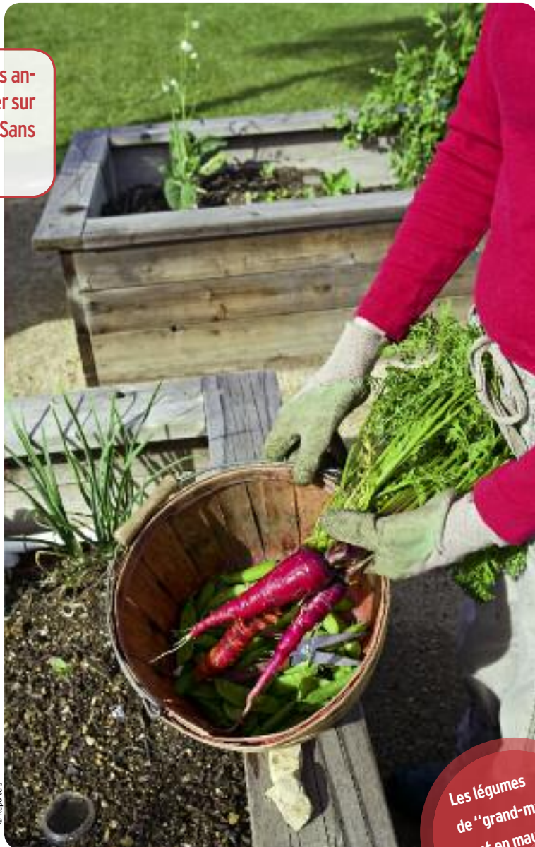
Les légumes de "grand-maman" sont en mauvaise posture.

L'été sera-t-il chaud pour les tomates Black Zebra, les épinards Matador et autres pois Serpette de Malines ? Dans le monde des associations environnementales et chez certains jardiniers, on se souvient avec amertume de l'été 2012 et on craint un nouvel orage, bien plus lourd de conséquences. Le 12 juillet dernier, la Cour de justice européenne avait rendu une décision tonitruante que rien ne laissait présager. En confirmant une certaine interprétation de la législation européenne, elle avait indirectement donné raison à un important semencier français opposé à Kokopelli, accusé de concurrence déloyale. Kokopelli est une association spécialisée dans la production et la