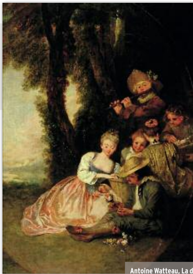
Antoine Watteau, La déclaration attendue , 18 ème siècle, Angers, Musée des Beaux-Arts.