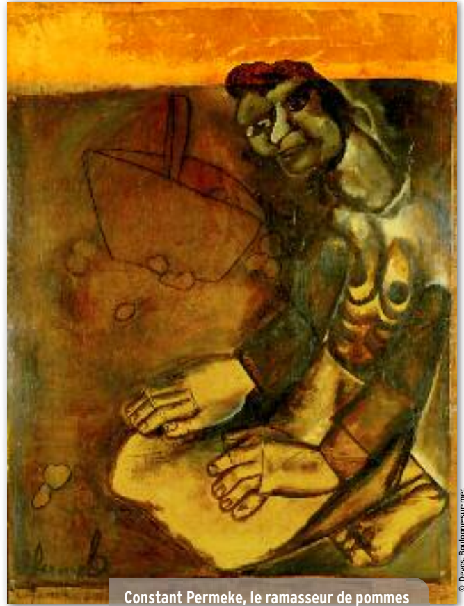
Constant Permeke, le ramasseur de pommes de terre, 1929 Collection MuZEE, Ostende.

En 36, Permeke expose une série de paysages grandioses et apaisés. La critique, mordante, dira que le peintre a perdu sa force créatrice, que la