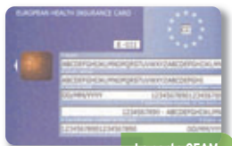
La carte CEAM