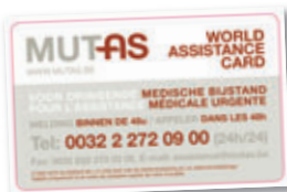
Votre World Assistance Card

Tous ces documents de voyage doivent être réclamés, avant votre départ, auprès de votre conseiller mutualiste, au numéro gratuit 0800 10 9 8 7 ou sur le site www.mc.be .