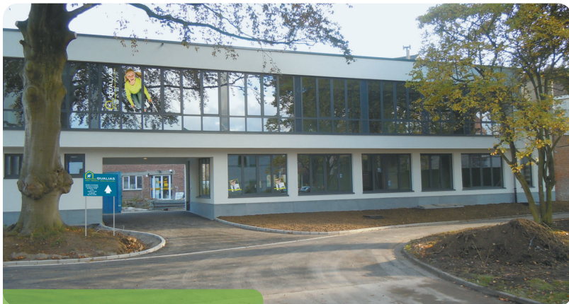
"Notre nouveau magasin de Tournai au 44 rue St Brice"

Comme annoncé dans nos précédentes éditions, nos magasins Espace Santé changent de nom et s'appelleront désormais Qualias. Rassurez-vous, la qualité du matériel et les conseils de notre personnel seront toujours au rendez-vous ! Les réductions pour les membres de la Mutualité chrétienne également.