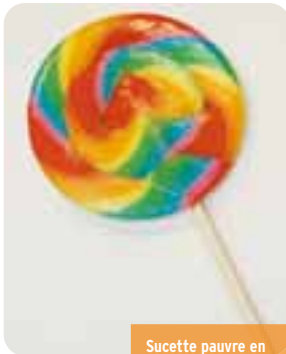
Sucette pauvre en graisse (100% sucre)