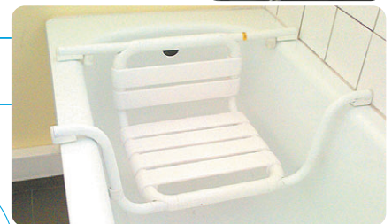
Siège de bain mi-hauteur

L'ASBL Solival apporte gratuitement des conseils et des solutions permettant d'améliorer l'autonomie et la qualité de vie des personnes vieillissantes à domicile.