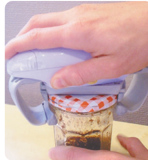
Ouverture automatique d'un bocal

Si vous souhaitez être recontacté par une ergothérapeute, retournez-nous