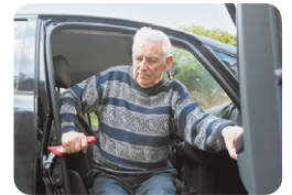
Appui pour sortir de la voiture

le talon ci-dessous complété via une boîte aux lettres de la mutualité. Nous prendrons alors contact avec vous pour l'organisation d'un rendez-vous. Vous pouvez également nous joindre au numéro suivant : 070/22.12.20.