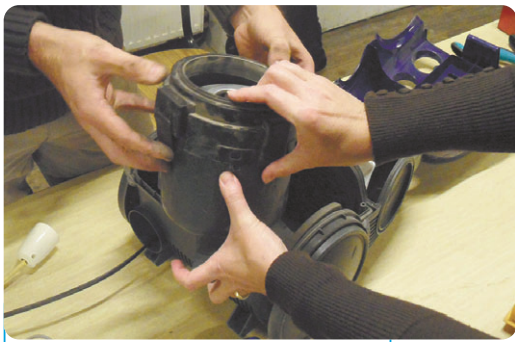
Un seul mot d'ordre : réparer ensemble. Ici, un aspirateur.

Pour concrétiser ce projet de Repair café à Momignies, les membres de l'Action locale du Mouvement ouvrier chrétien (MOC) recherchent des bénévoles. > Vous êtes bricoleur, vous avez de "l'or dans les doigts", vous aimez chercher comment réparer un ustensile ménager, les vélos n'ont aucun secret pour vous, la couture ou