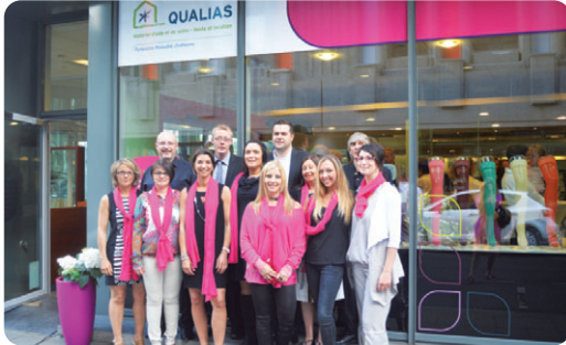
Une équipe à votre service à Liège-centre, au Sart-Tilman et à Eupen !

Mais Qualias, ce n'est pas seulement de la vente : l'enseigne vous propose également en location du matériel d'aide et de soins et de puériculture dans ses magasins de Liège et du Sart-Tilman ainsi que dans votre agence MC habituelle.