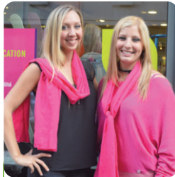
Deux nouveaux visages vous accueilleront pour la vente et la location dans la nouvelle enseigne de la rue du Méry.