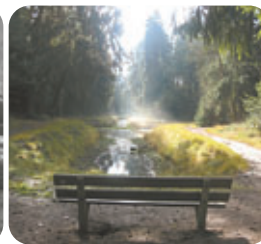
Les groupes de l'Espace Citoyen de Dampremy et de la Braise avaient participé à notre concours photo sur les déterminants de la santé l'année dernière.

voiture, éviter les produits toxiques et polluants (insecticides, pesticides, eau de javel, produits nettoyants irritants...), éviter les produits "sur-emballés", acheter "local et de saison", trier les déchets, aérer la maison, respecter les limitations de vitesse (notamment en cas de smog). Les exemples sont nombreux.